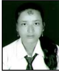
पूधीमाया परियार ६७.८०%