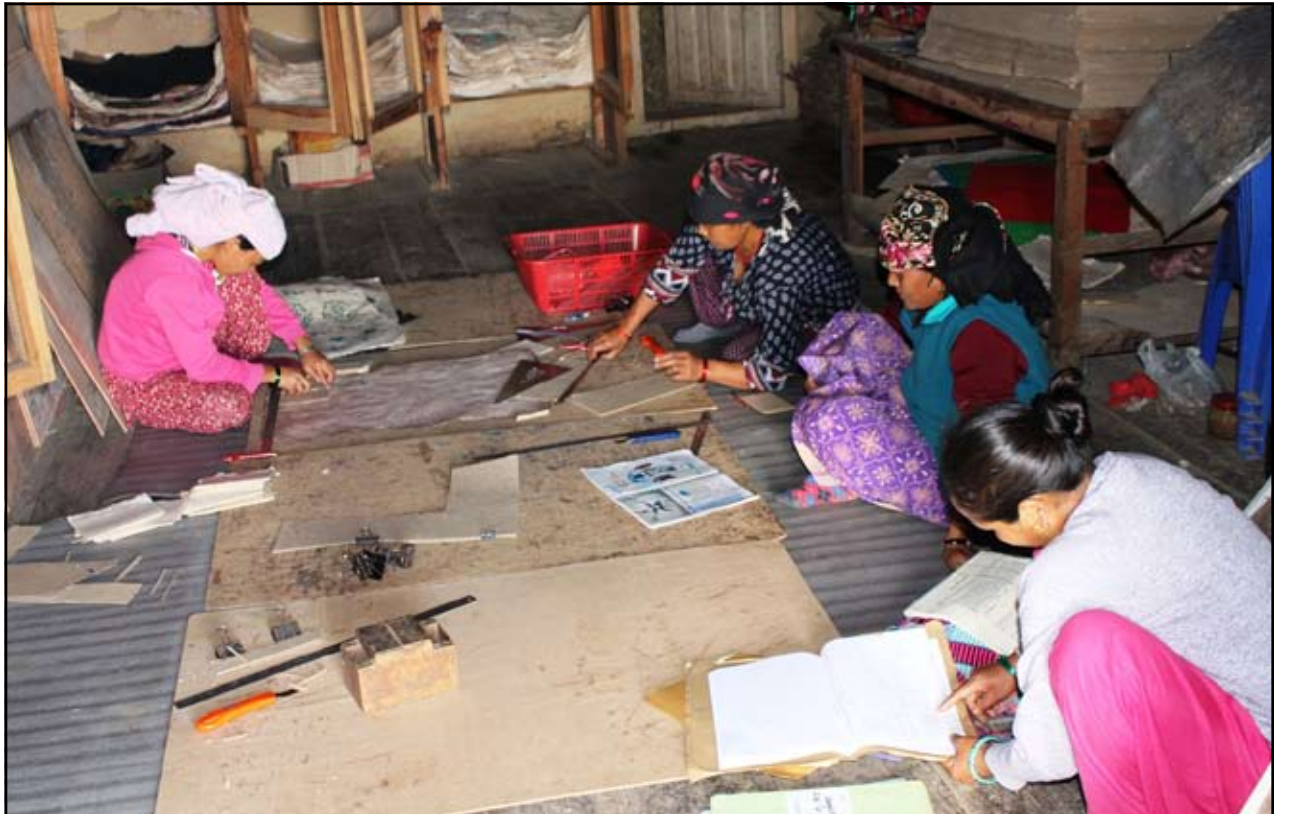
नेपाली कागजको सामग्री बनाउँदै : म्याग्दीको अन्नपूर्ण गाउँपालिका ८ नागीमा रहेको हिमाञ्चल हाते कागज उद्योगमा नेपाली कागजबाट विभिन्न सामग्री बनाउँदै महिला उद्यमीहरू । नेपाली कागजबाट उनिहरूले डायरी, नोटबुक, सपीड ब्याग, ल्याम्प सेटका साथै विभिन्न गहनाहरू समेत तयार पार्ने गरेका छन् ।