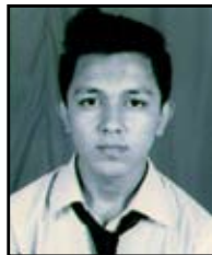
सफल खड्का ६५.८०%