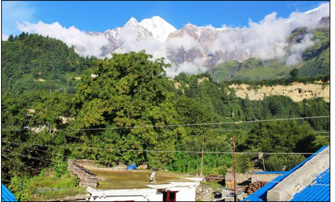
हिमाली सौन्दर्य : मुस्ताङको थासाङ गाउँपालिका २ कोवाङबाट देखिएको धौलागिरी हिमालको दृष्य । निलगिरी र धौलागिरी हिमालको फेदीमा रहेको कोवाङ गाउँ पर्यटकीय दृष्टिकोणले सम्भावनायुक्त छ । कोवाङको पुर्वतर्फ निलगिरी र पश्चिमतर्फ धौलागिरी हिमाल अवस्थित छ ।