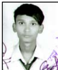
सरेन बानियाँ ६२.२०%