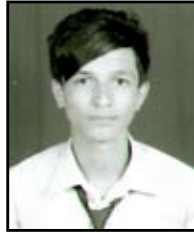
ईश्वर जिंसी ७०.४०%