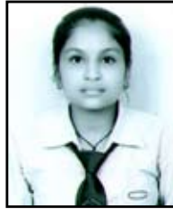
सोपियाकुमारी जिंसी ७२.२०%