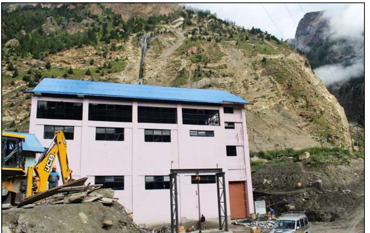
थापाखोलाको विद्युतगृह : मुस्ताङको थासाङ गाउँपालिका १ टुकुचमा निर्माण भएको १३.६ मेगावाट क्षमताको थापाखोला जलविद्युत आयोजनाको विद्युतगृह । माउन्ट कैलाश ईनर्जी प्रा.लीले निर्माण गरेको थापाखोला जलविद्युत आयोजनाले परिक्षण उत्पादन सुरु गरेको छ । असोजदेखि उत्पादीत विद्युत केन्द्रिय प्रसारण लाईनमा जोड्ने थापाखोला जलविद्युत आयोजनाले तयारी गरेको छ ।