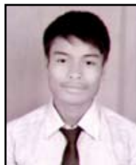
टिकाजीत पुन ६४.००%