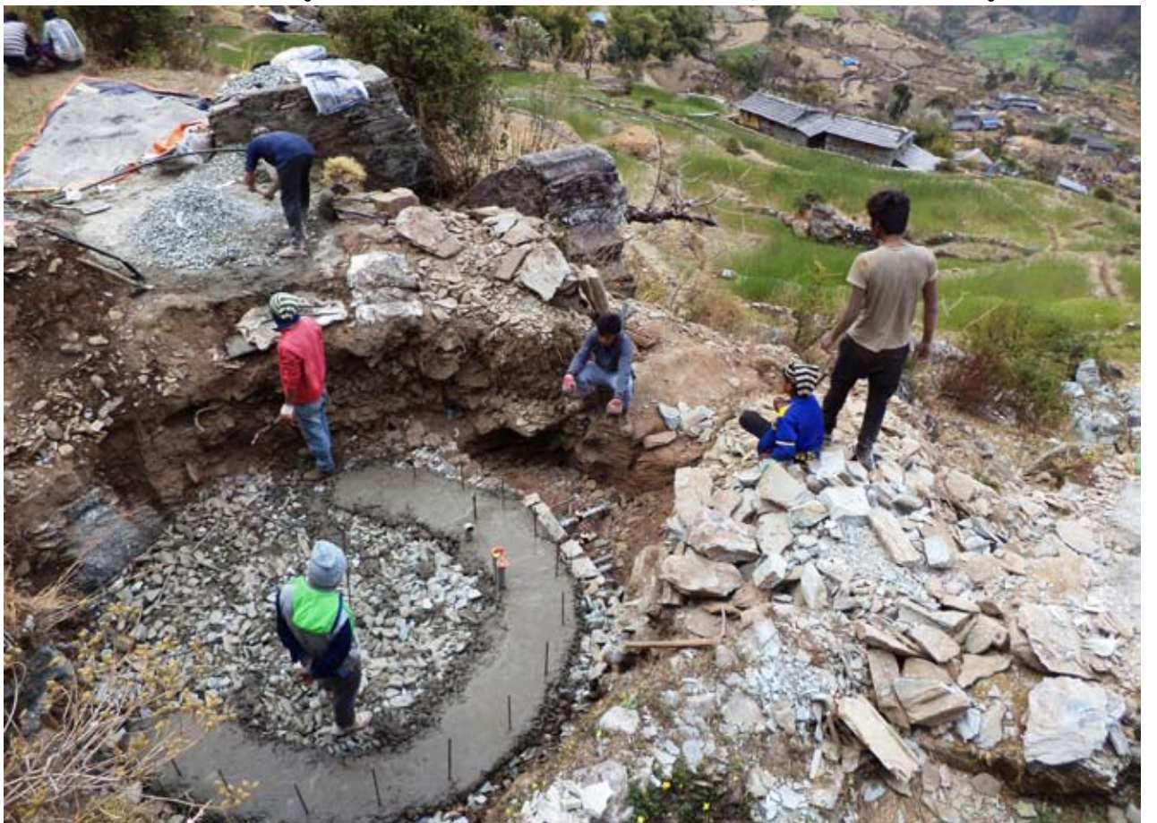
खानेपानीको टकी निर्माण गर्दै : धौलागिरी गाउँपालिका ७ ताकमको मच्छिम, शिवाड र हिलापोखरी गाउँका सबै घरमा निजी धारा जडान गर्ने लक्ष्य सहित सञ्चालित खानेपानी आयोजनाको टकी निर्माण गरिँदै ।