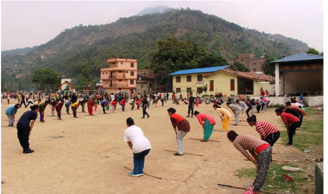
म्याग्दी प्रहरी तालीममा : बैशाख ३१ गते हुन लागेको स्थानीय तह निर्वाचनका लागि म्याग्दीमा भर्ना गरीएका म्याग्दी प्रहरीहरुलाई बेनीको खुल्ला मञ्चमा तालीम