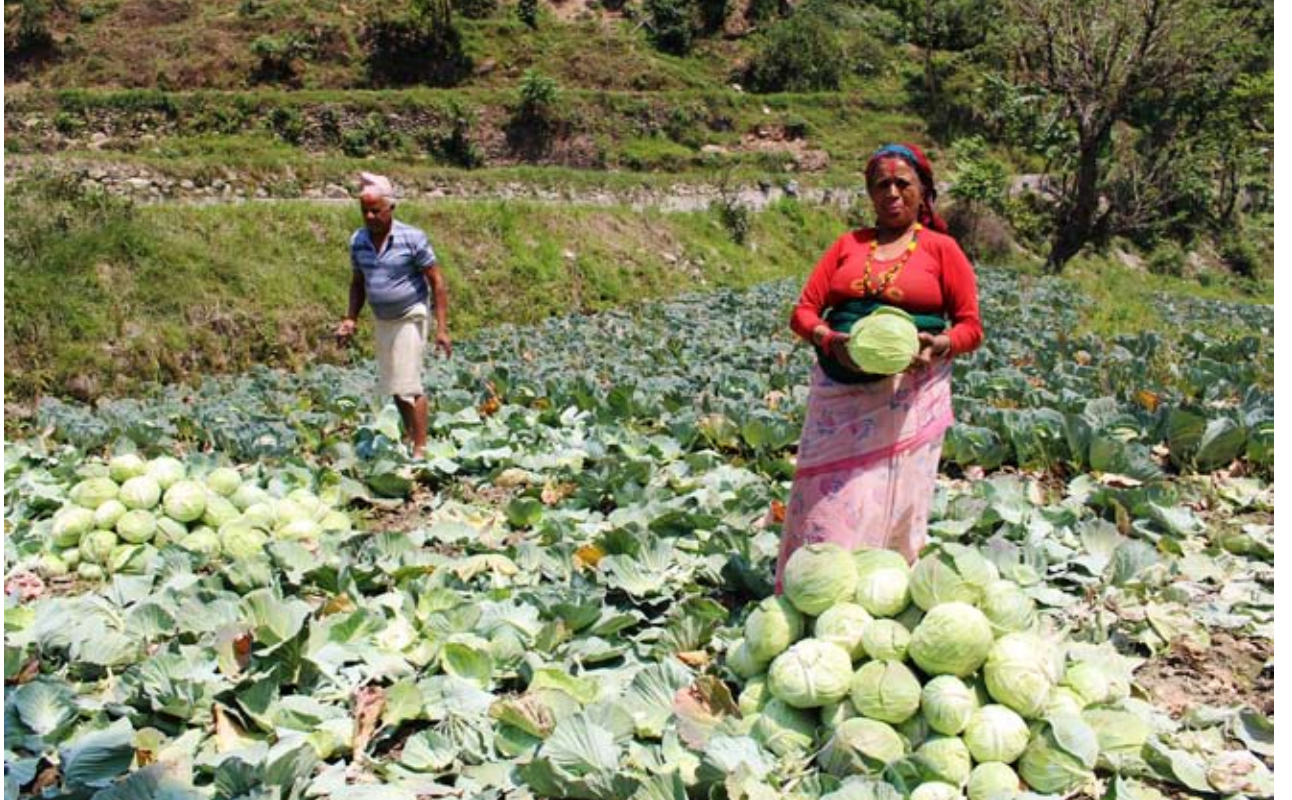
पौरखी कृषक : पर्वतको जलजला गाउँपालिका ७ धार्डीरीड केराबारीका कृषक बारीमा उत्पादन भएको बन्दा बजार पठाउने तयारी गर्दै । मालढुङ्गा बेनी सडक आसपासको क्षेत्रका कृषकहरु व्यवसायिक तरकारी खेतीबाट राम्रो आमदानी गर्न सफल भएका छन् ।