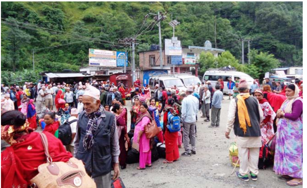
सोह श्राद्धका लागि कागबेनी जान लागेका तिर्थयात्रीहरूको बेनीको कालीपुल बसपार्कमा लागेको भिड । बेनी जोमसोम सडक सिधा सञ्चालन भएसँगै तिर्थयात्री र पर्यटक बढेका छन् ।