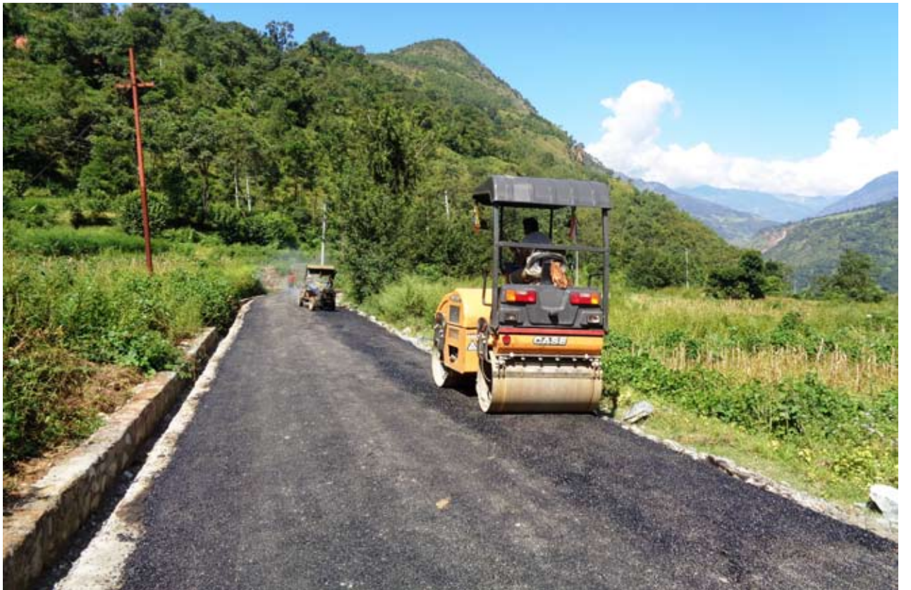
बागलुङ-बेनी सडकको रत्नेचौर खण्डमा कालोपत्रे गरिँदै । सडक डिभिजन कार्यालय बागलुङले यस वर्ष बेनीसम्मको सबै सडक कालोपत्रे गर्ने जनाएको छ ।