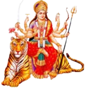
राजेन्द्रप्रसाद सेटाई प्रिन्सिपल

हार्दिक मङ्गलमय शुभकामना व्यक्त गर्दछौं ।