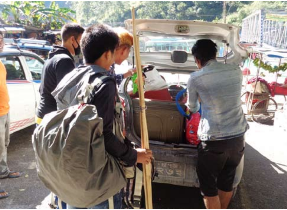
दसैं मनाउन ट्याक्सी चढेर घर फर्कदै ।

रोजगार, अवसर र सुबिधाको खोजी तथा अध्ययनका लागि