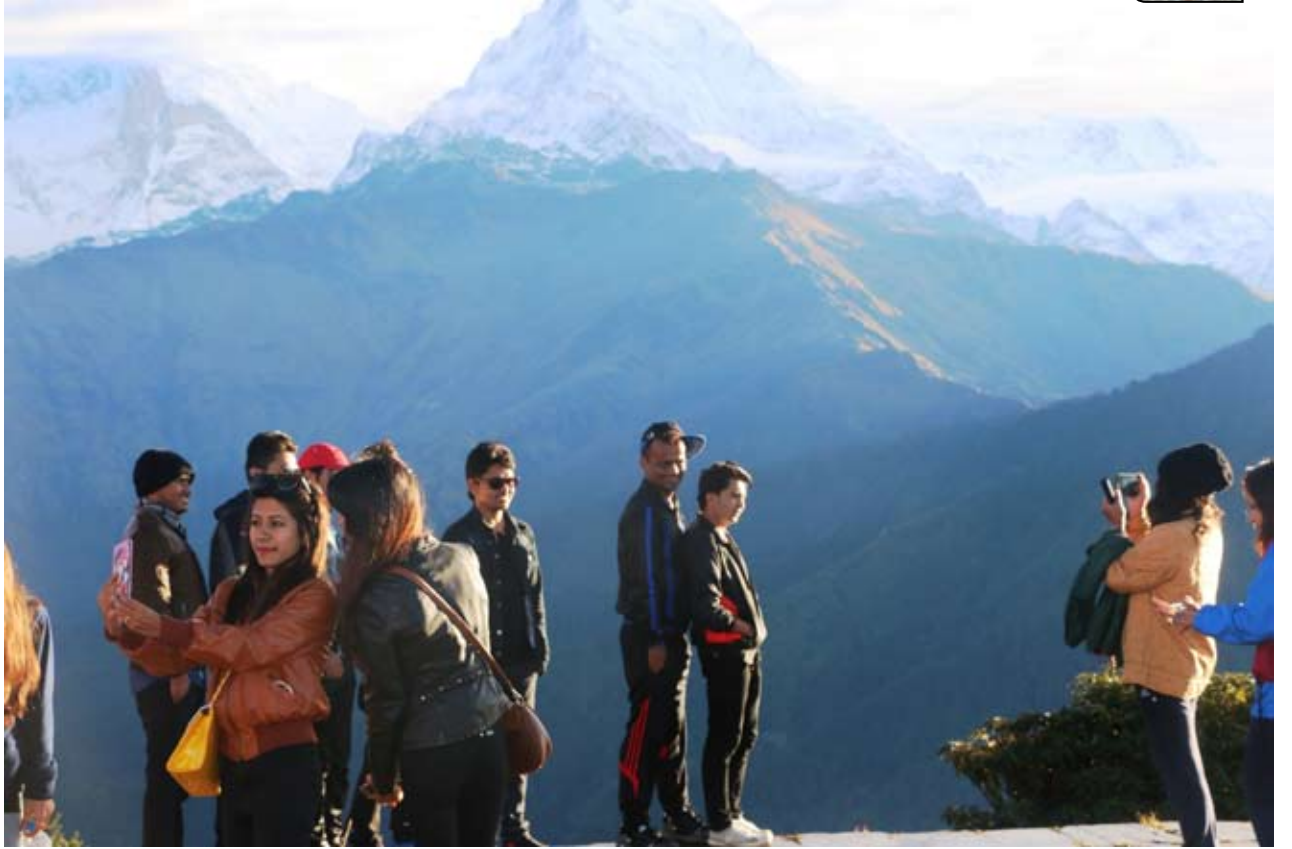
म्याग्दीको घर १ स्थित पुनहिलमा प्राकृतिक सौन्दर्यतामा रमाएर सेल्फी खिच्दै गरेका आन्तरीक पर्यटकहरू । समुन्द्र सतहदेखि तिन हजार २१० मिटरको उचाईमा अवस्थित पुनहिल सुर्खोदय, हिमशृङखला, पहाडी भुगोल र वनजंगलको अवलोकनका लागि आकर्षक गन्तव्य मानिन्छ ।