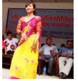
तीज गीतको सौन्दर्य गुम्दै - विस्तृत अन्तिम पृष्ठमा