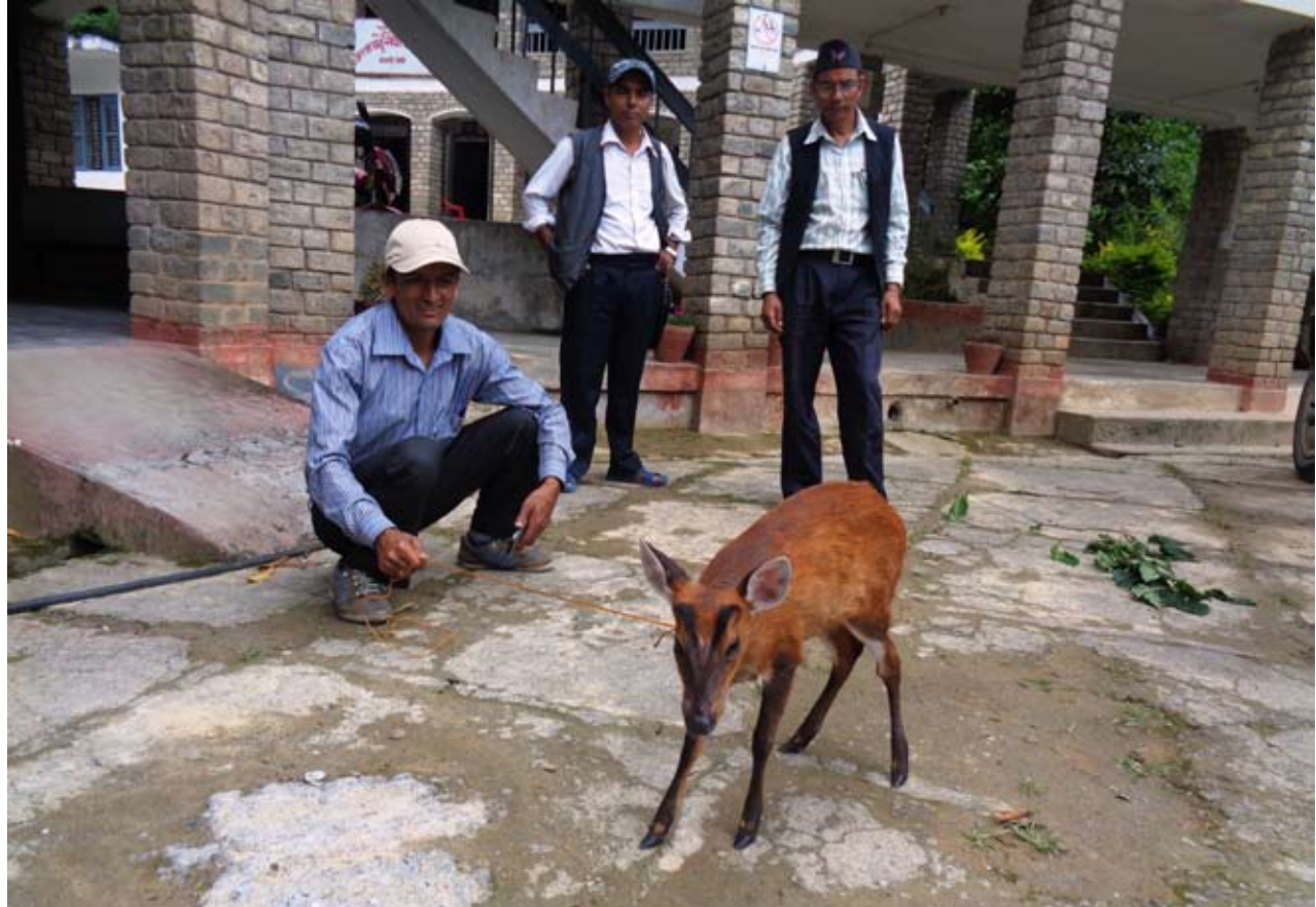
मृगको उद्धार : म्याग्दीको अर्मन ३ छिस्वाङबाट बिहीवार उद्धार गरेर जिल्ला वन कार्यालयमा ल्याइएको रतुवा मृगको पाठो ।