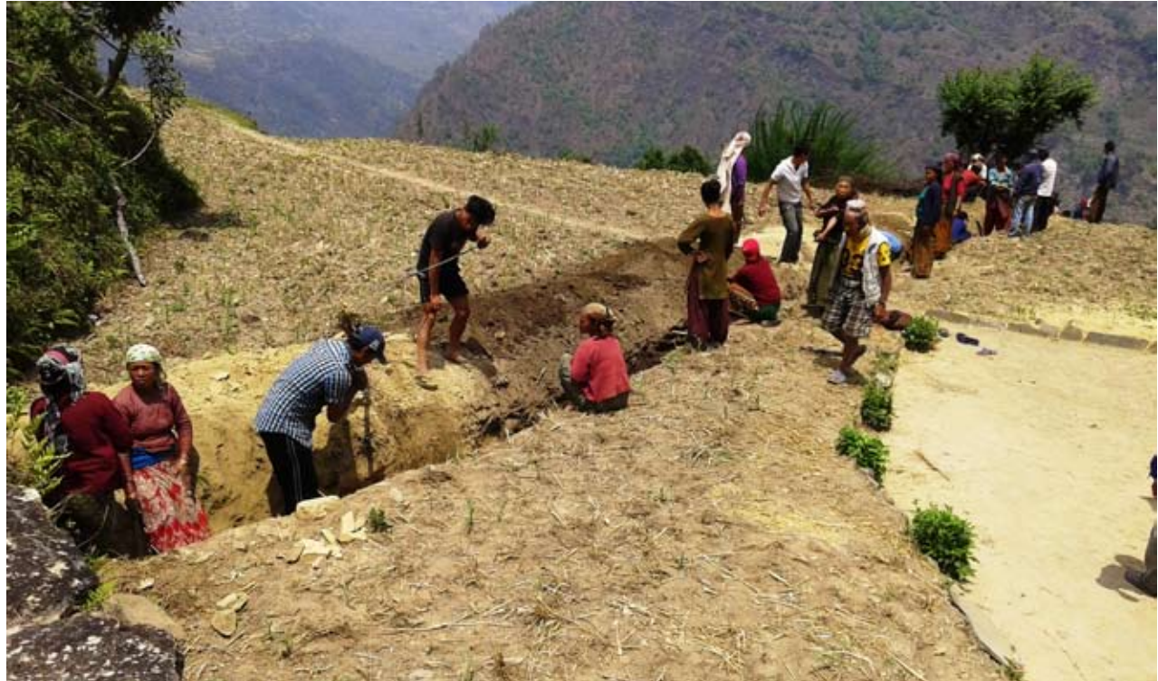
श्रमदान : विमको ट र ५ नम्बर वडामा पर्ने बाईन्डफाँटमा बिम्वाङ खानेपानी आयोजनाको पाईप बिध्याउने खाडल खन्दै उपभोक्ताहरु ।