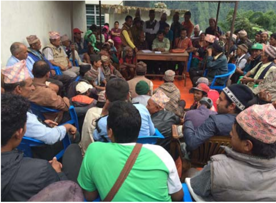
म्याग्दीको ताकममा स्थानीय तह पुनर्संरचना वारे छलफल गर्दै स्थानीयहरू ।

केन्द्र कहाँ बनाउने विषयमा स्थानीयबासी, दलका नेता र सरोकारवालाहरूको विचार बाँझिएको