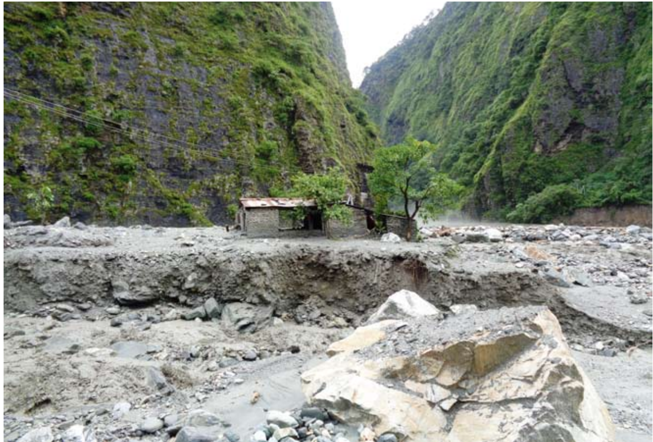
बाढीले बस्तीलाई बगर बनायो : बाढीले बगरमा परिणत गरेर उराठलाग्दो बनाएको बेगखोला ।