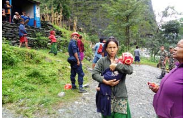
बाढीले विचल्ली : बाढीले घर बगाएपछि विस्थापित बेगखोलाकी एक बाढीपीडित बच्चालाई काँखमा च्यापेर सुरक्षित आश्रयको खोजी गर्दै ।

म्याग्दीको बेगमा र देविस्थान गाविसमा विहीवार र शनिवारको बाढी, पहिरोका कारण एकको मृत्यु भएको छ । पहिरोमा परि एक जना वेपता भएका छन भने १५ घरपरिवार प्रभावित भएका छन् । बेगखोलामा वेलीब्रिज, भोलुङ्गे पुल, सडक र बिजुलीको पोल समेत बाढीले बगाएको छ ।