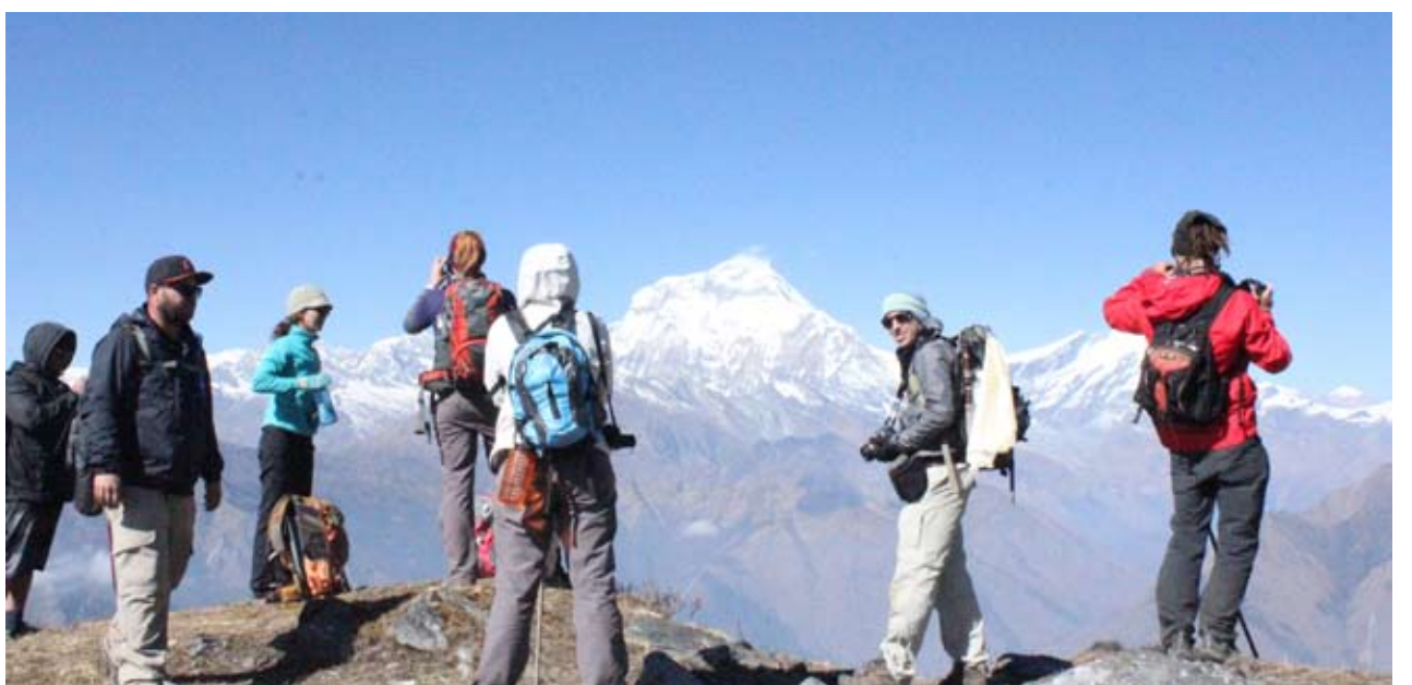
खोप्रामा पर्यटक : म्याग्दीको पर्यटकीय स्थल खोप्रालेकबाट धौलागिरि हिमालको दृष्य अवलोकन गर्दै । पछिल्लो समय खोप्रालेक पर्यटकको रोजाइमा पर्ने गरेको छ ।