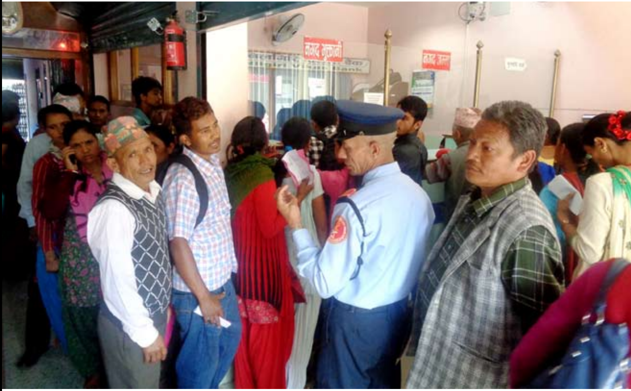
गरिमा विकास बैंकको बेनी शाखामा सेवाग्राहीको भिडभाड ।