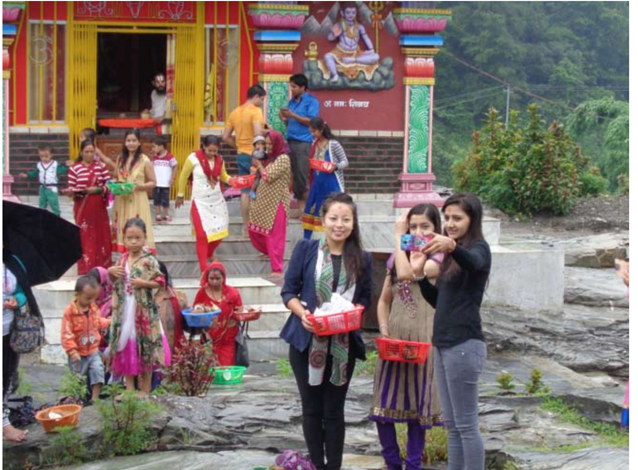
भक्तजनको सेल्फी मोह : बेनी नगरपालिका ५ गलेश्वर स्थित राधाकृष्ण मन्दिरलाई पृष्ठभूमिमा पारेर सेल्फी खिच्दै भक्तजन ।