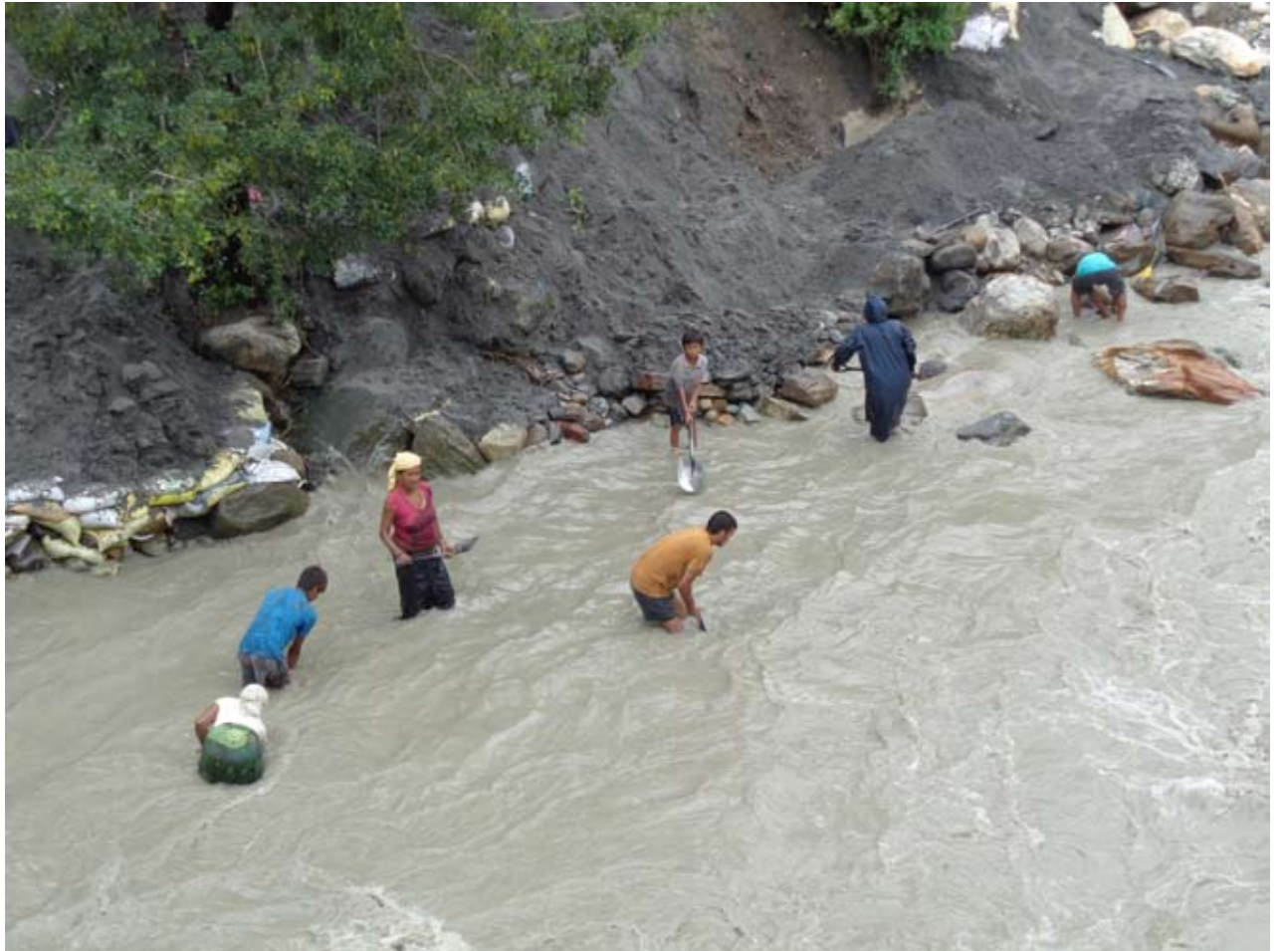
गरिबको बाध्यता : बेनी स्थित म्याग्दी नदीमा उर्लदो बर्खे भेलको सामना गर्दै किनारबाट बालुवा निकाल्दै मजदुरहरू ।